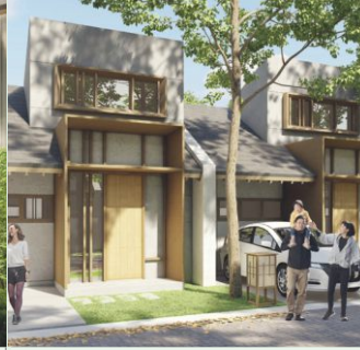
TSUBAKI 6x12 Bedroom: 2 Bathroom: 1 Garage: 1