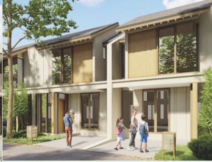
SAKURA 6x12 (2 floors) Bedroom: 3 Bathroom: 2 Garage: 1