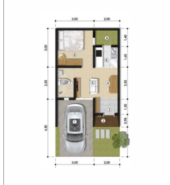
Luas Tanah 50 | Luas Bangunan 30.1