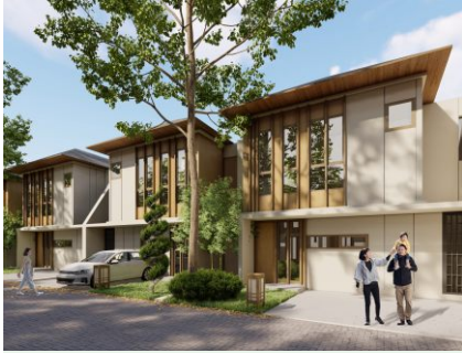
HIMAWARI 8x14 (2 floors) Bedroom: 3 Bathroom: 2 Garage: 1