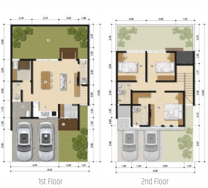
Luas Tanah 112 | Luas Bangunan 104.2