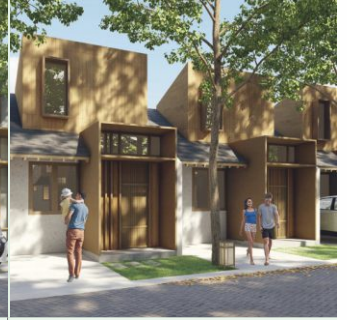
YURI 5x10 Bedroom: 1 Bathroom: 1 Garage: 1