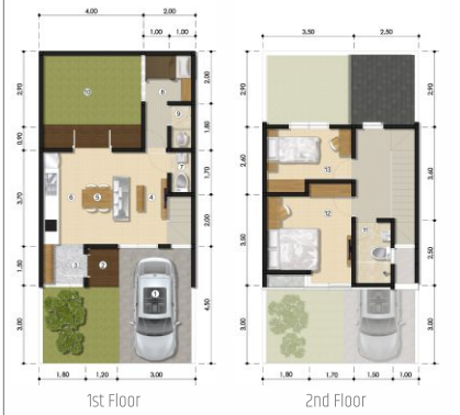
Luas Tanah 72 | Luas Bangunan 71.9