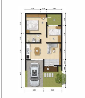
Luas Tanah 72 | Luas Bangunan 46.1